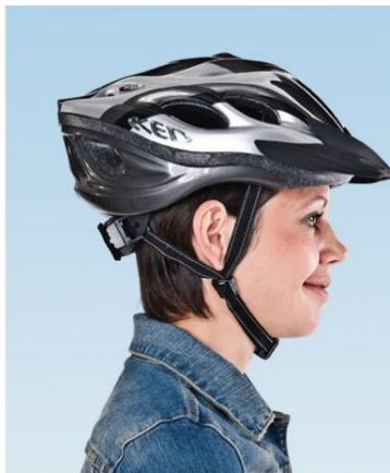
2. Seitenbänder gleich satt, zwischen Kinn und Band Platz für einen Finger