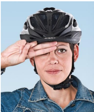
1. Zwei Finger breit über der Nasenwurzel