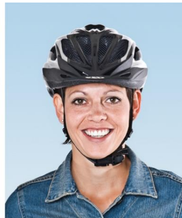
3. Sitzt perfekt! Gute Fahrt!